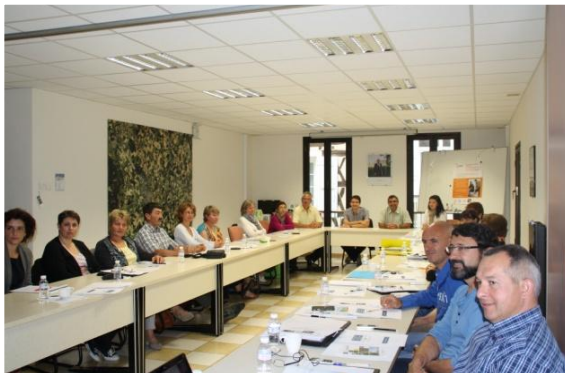
Réunion à Nérac

ERDF et le Sdee47 ont organisé, courant juin, une dizaine de réunions d'information à l'attention des secrétaires de mairie et des personnels des Collectivités Locales afin de renforcer le lien de proximité entre les différents acteurs concernés par la distribution publique d'électricité : Sdee47, ERDF, Collectivités Locales et clients.